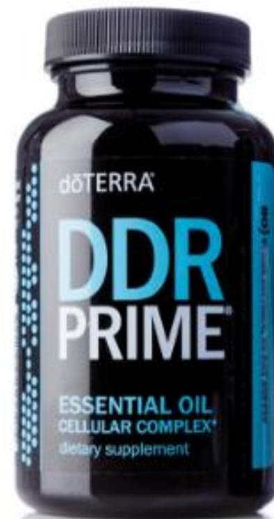
DDR Prime® Клеточный комплекс