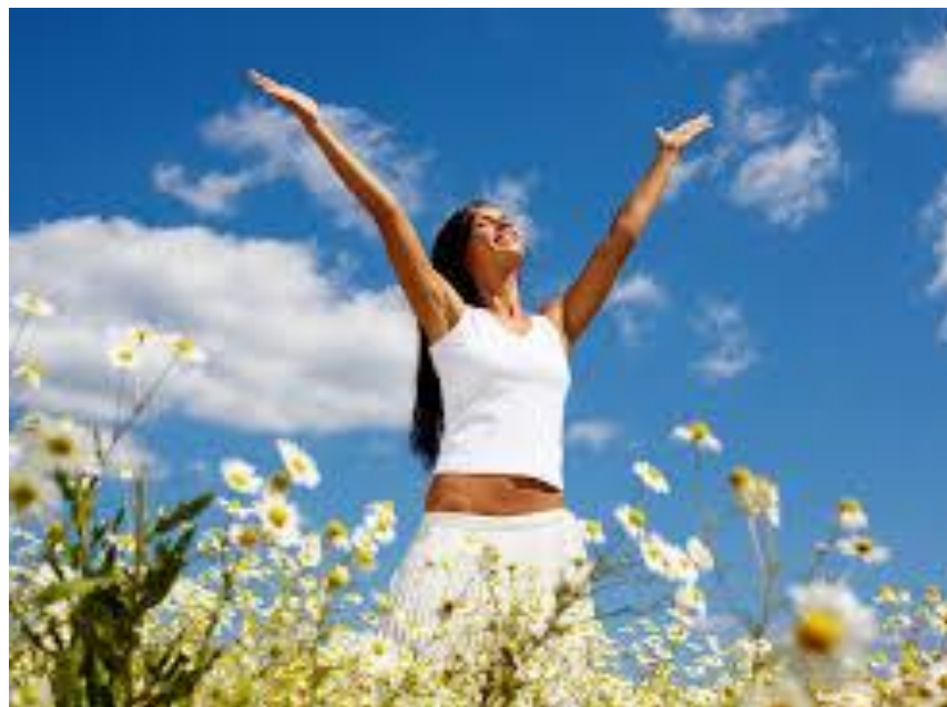
Microplex VMz® Комплекс витаминов и минералов