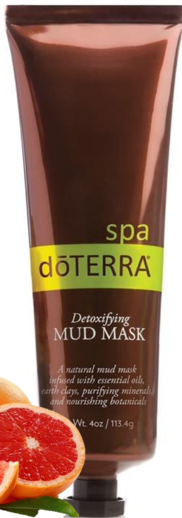
SPA Detoxifying Mud Mask / Грязевая детоксицирующая маска