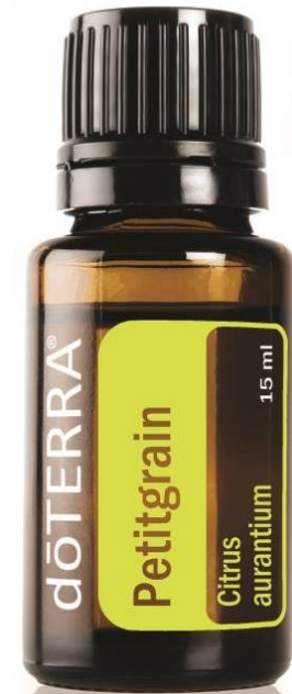
Petitgrain Essential Oil / Петитгрейн, эфирное масло