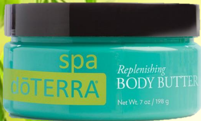
SPA Replenishing Body Butter \ Восстанавливающее масло для тела