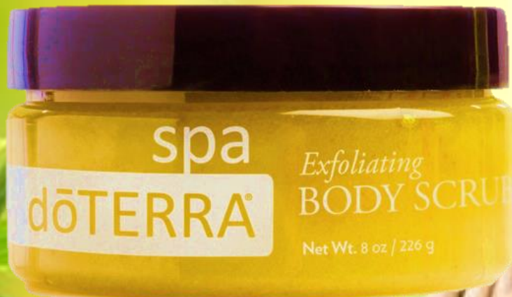
Exfoliating Body Scrub / Отшелушивающий скраб для тела