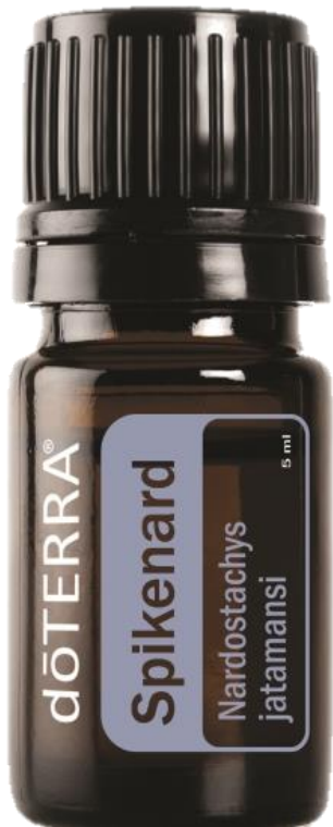
SPIKENARD ESSENTIAL OIL / Нард, эфирное масло