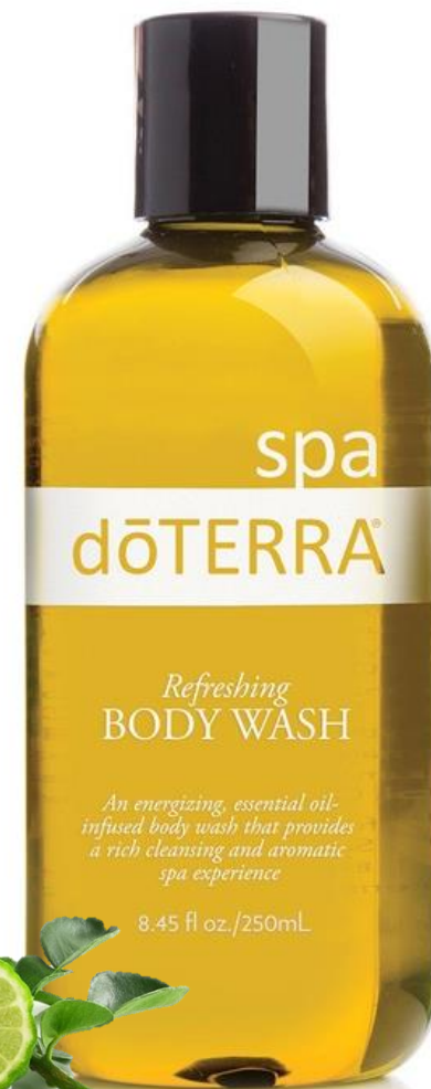
SPA Refreshing Body Wash / Освежающий гель для душа