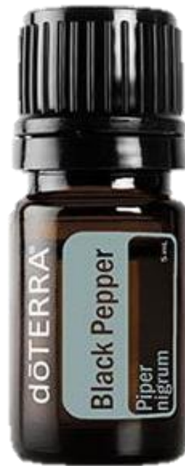
BLACK PEPPER ESSENTIAL OIL / Черный перец, эфирное масло