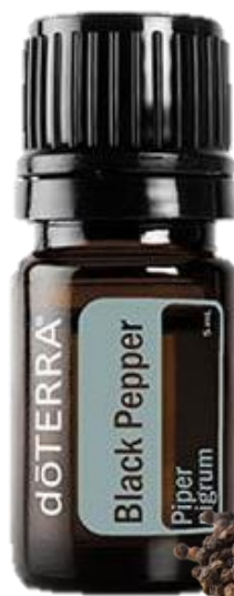
BLACK PEPPER ESSENTIAL OIL / Черный перец, эфирное масло