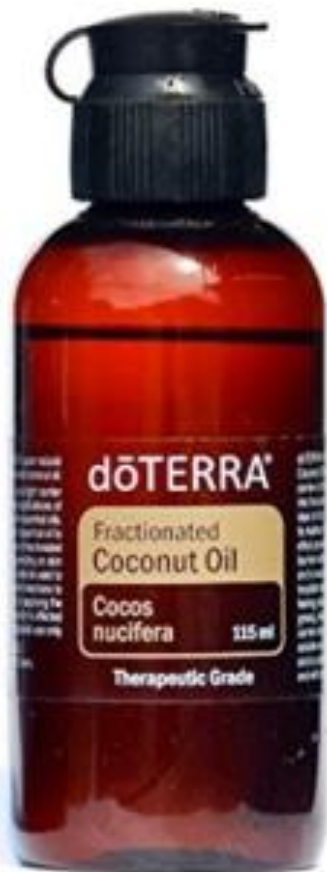
FRACTIONATED COCONUT OIL / Фракционное кокосовое масло